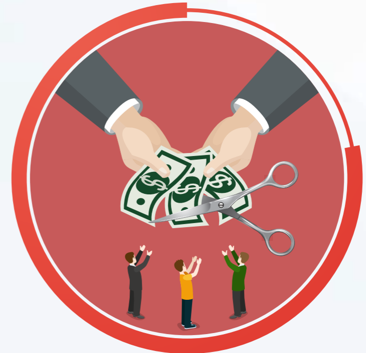
Cắt lương thay cho việc xử lý kỷ luật lao động.