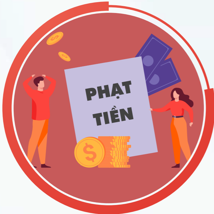
Phạt tiền thay cho việc xử lý kỷ luật lao động.