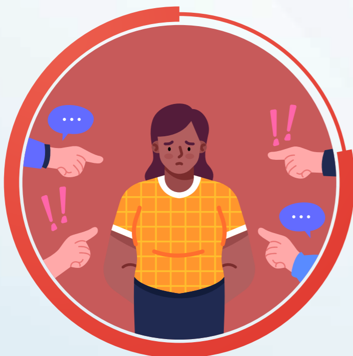
Xâm phạm sức khỏe, danh dự, tính mạng, uy tín, nhân phẩm của người lao động.