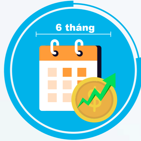
Kéo dài thời hạn nâng lương (không quá 06 tháng)